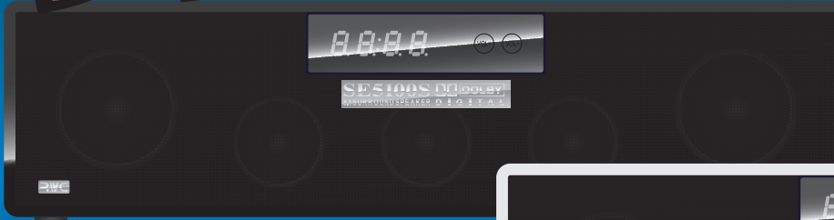
RM-SE5100SK : ブラック